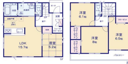
タクトホーム(株) 盛岡店